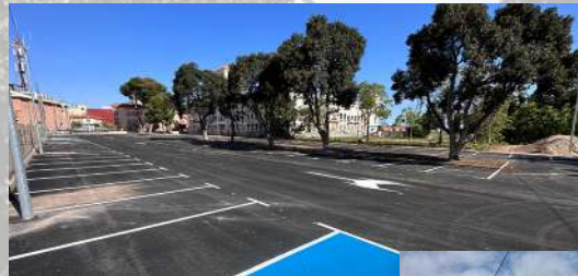
Aparcamiento disuasorio en San Javier en calle Párroco Cristobal Balaguer

Se ha realizado una inversión de 48.000€.